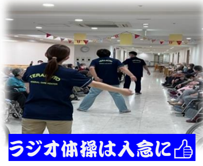
ラジオ体操は入念に👍

5月22日（水）に各療養棟では運動会を行いました。両階ともに白熱の戦いが繰り広げられ、職員の声も最後は疲労気味。笑まずご利用者様と一緒に全身運動のラジオ体操からスタートでしたが、1曲体操するだけで、じんわりと身体がホカホカしてきました👏お次の競技は早速ご利用者様の出番。チーム対抗戦の「棒送り」。2チームに分かれお隣さん同士協力をしながら4本の棒をパスしていく競技なのですが、持っている方と反対側の先端を